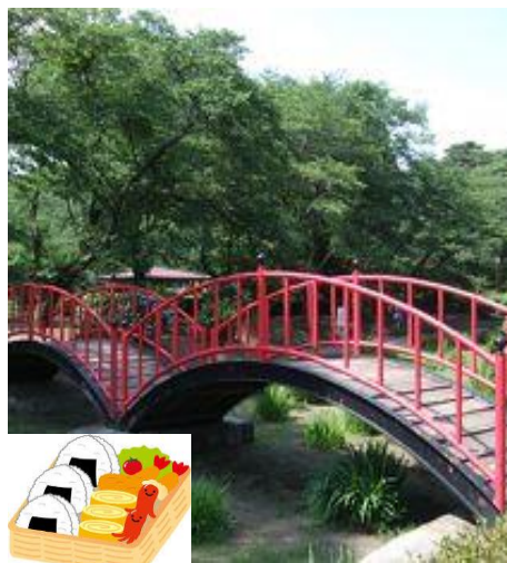
鳥ヶ森公園でお弁当タイム♪ Lunch at Karasugamori Park

Nasusosui&Tiger globefish (Torafugu) Farming with hot spring