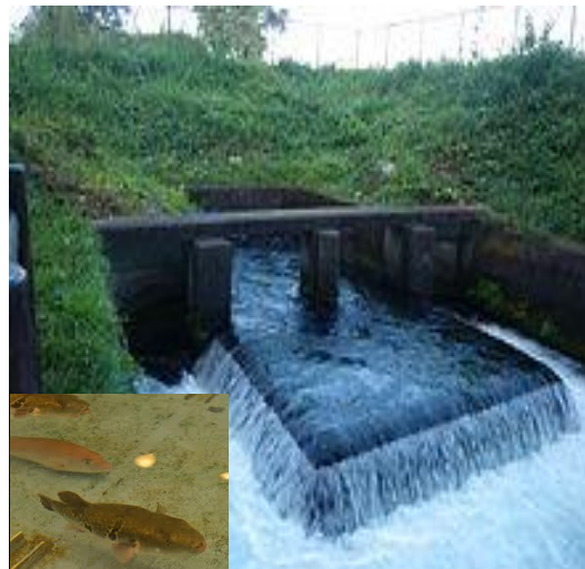
那須味水&温泉とらふぐ

Nasusosui&Tiger globefish (Torafugu) Farming with hot spring