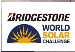
ブリヂストン 栃木工場