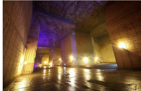
ร่องรอยของเมืองแร่ขนาดใหญ่ (ช่องว่างใต้ดิน)

พิพิธภัณฑ์โอยะร่องรอยของการทำเหมืองแร่หินโอยะ มีอายุประมาณ 70 ปี โดยเริ่มทำตั้งแต่ปี 1919 ถึงปี 1986 เป็นช่องว่างใต้ดินที่มีพื้นที่ขนาดใหญ่มาก มีความกว้าง 20,000 ตารางเมตร (140m × 150m) สามารถบรรจุสนามเบสบอลได้ 1 สนาม ภายในมีอุโมงค์ถ้ำตลอดปี ประมาณ 8 องศา คล้ายกับตู้เย็นชั้นใต้ดินขนาดใหญ่ ในระหว่างสงครามใช้เป็นที่ก่อสร้างลับใต้ดิน