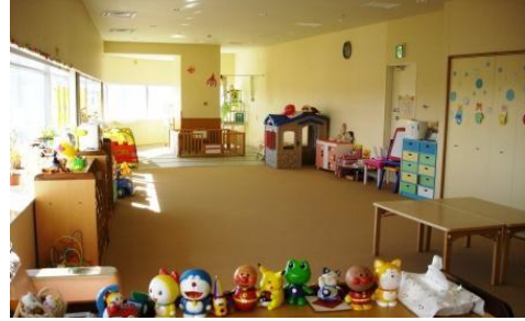
Nơi nhận trông trẻ tạm thời

Sân chơi Yuai ở tầng 6 của tòa nhà Utsunomiya Hyosando Square. Ở đây có rất nhiều đồ chơi lớn, trẻ em có thể tham gia các lớp thực hành thủ công. Ngoài ra, trung tâm cũng trông giữ tạm thời trẻ từ 6 tháng tuổi đến trẻ trước khi vào lớp 1.