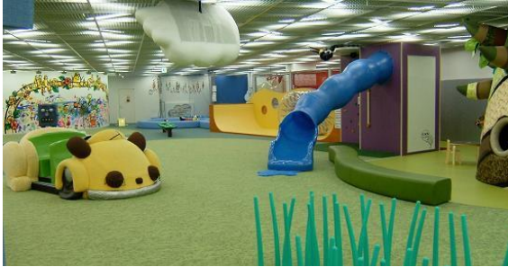
Có rất nhiều đồ chơi hấp dẫn

Giới thiệu sân chơi dành cho trẻ em “Yuai hiroba”. Đây cũng là nơi có thể trông giữ trẻ tạm thời và có trung tâm hỗ trợ gia đình hỗ trợ.