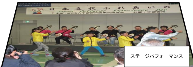
ステージパフォーマンス

高級和菓子配布（抽選）やおにぎり体験などもあり、お腹も満足して観て回ることができます。初めての方も、国際交流の熱気に包まれてみましょう！ご来場お待ちしております。