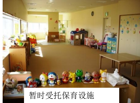
暂时受托保育设施

友爱广场设在宇都宫市表参道スクエア的6楼。在这里孩子们可以利用大型玩具进行玩耍或参加手工制作教室等。还受托照看出生6个月到小学生为止的儿童。