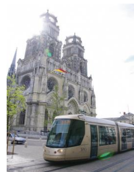
LRT em frente a Catedral St.Croix.

É possível realizar vários intercâmbios por ser cidade irmã. Recomendo fazer homestay em Orléans, estudar nas escolas de Orléans e de lá visitar Paris. Vamos conhecer a minha cidade, aproveitando os méritos de cidade irmã!