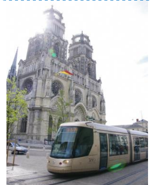
LRT ที่วิ่งผ่านหน้าอาสนวิหารกางเขน ศักดิ์สิทธิ์

เนื่องจากเป็นเมืองที่เมืองน้องกันจึงทำให้เกิดการแลกเปลี่ยนของชาวเมือง อาจจะขอแนะนำให้ไปปารีส ในระหว่างอยู่โฮมสเตย์ที่ออร์ลีนหรือนักเรียนแลกเปลี่ยนที่เมืองออร์ลีน นอกจากนี้ยังสามารถสัมผัส ประสบการณ์และการแลกเปลี่ยนที่หลากหลายเนื่องจากเป็นเมืองที่เมืองน้องกัน กรุณาไปเมืองออร์ลีนให้ ได้โดยใช้ข้อดีจากการเป็นเมืองที่เมืองน้องให้มีประโยชน์